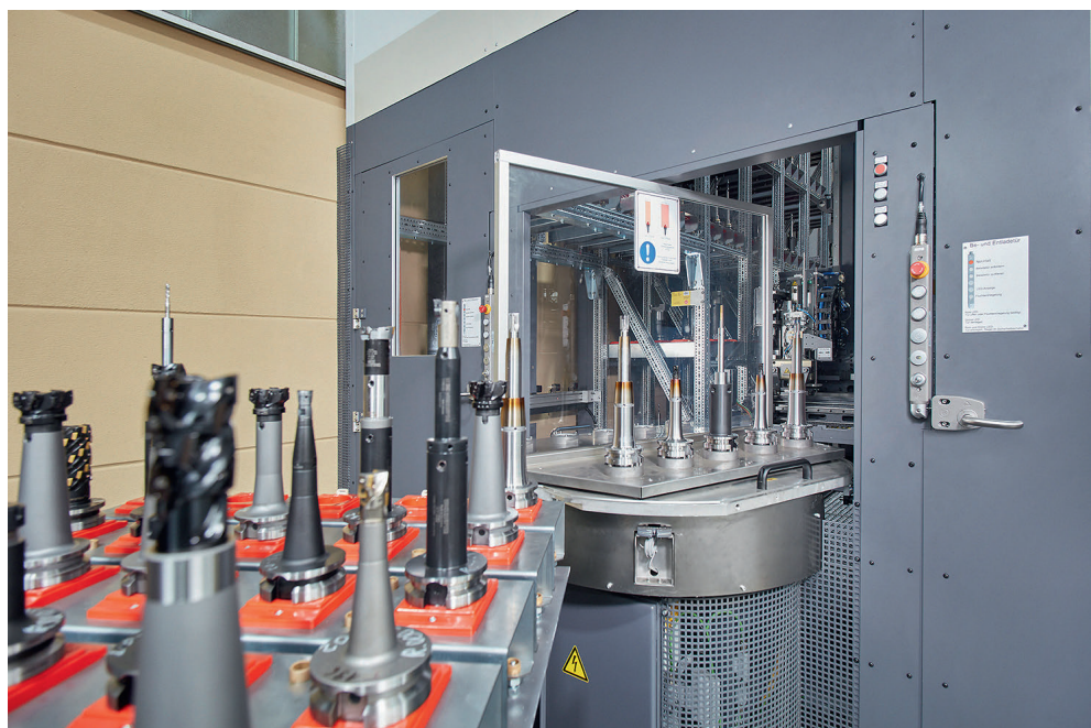
1 Die Werkzeugverwaltung erfolgt automatisiert über ein zentrales Werkzeugmagazin mit über 1000 Lagerplätzen

Jeder Werkzeugträger ist mit einem Chip versehen, den das Bediengerät ausliest. Er enthält Informationen zu Größe, Durchmesser, Kontur und der Reststandzeit des Werkzeugs. So ist zum einen sichergestellt, dass die Standzeit zur jeweiligen Auftragsmenge passt. Zum anderen muss das Magazin die Werkzeugträger platzsparend bestücken. Deshalb sind die Konturen hinterlegt, sodass Kollisionen auf dem Drehteller oder dem Wagen ausgeschlossen sind.