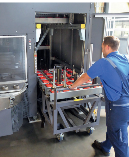
4 Das automatische Werkzeugmagazin verwaltet nicht nur einzelne Werkzeuge, sondern auch den gesamten Werkzeugwagen für einen Auftrag