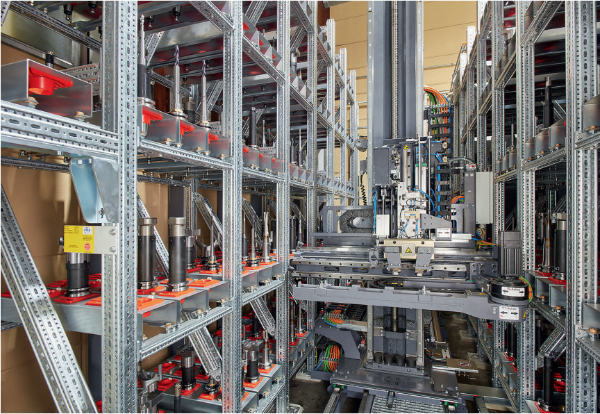
3 Das Regalbediengerät stellt anhand der Auftragsdaten die benötigten Werkzeuge zusammen

Werkzeugverwaltung, aber nicht der Automatisierung. Hier ist vorgesehen, dass ein Mitarbeiter einmal pro Schicht die Maschinen abläuft und scharfe Werkzeuge bevorratet. So entsteht keine Wartezeit, wenn ein Werkzeug getauscht werden muss.